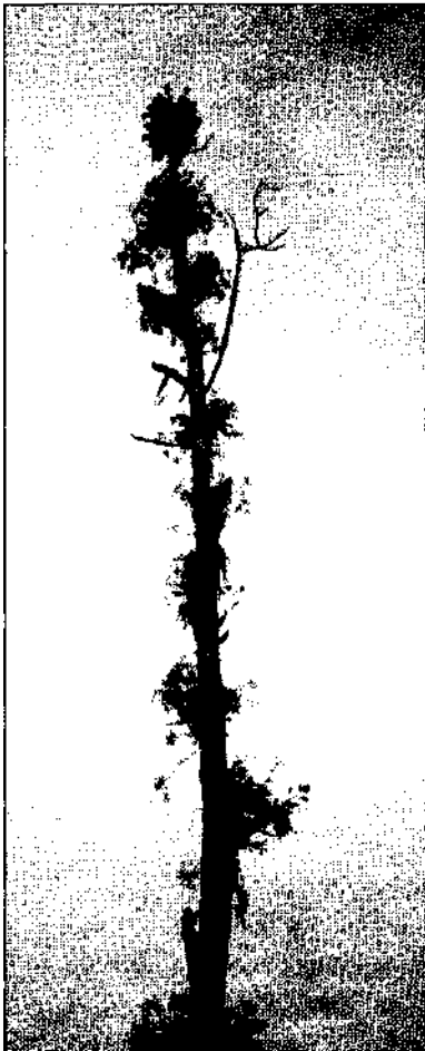
Papuoštas kupolės medis.

gaubtuvių - „Ar aš nesakiau tau, seserėle“ (neik per linų laukelį).