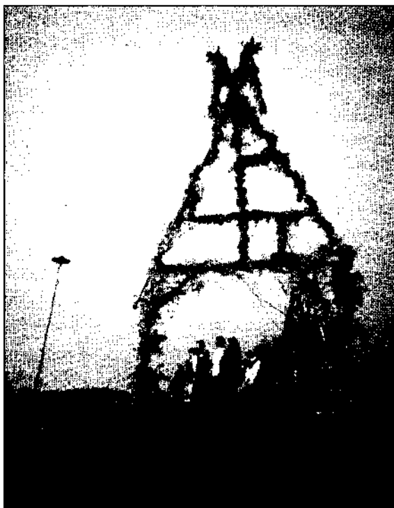
Palydima „aplank dangų einanti“ vakaro saulė.

Karinės dainos: „Gale lauko ažuolėlis auga“ (po juo lovelė, lovelė bernelis), „Žalioj girioj, lygioj lankoj“ (apie sūnų, pavirtusi ažuolu), „Ažuolėli, žalias medeli“, „Nesprok, žalias arzuolėli“, „Oi ant kalno, ant aukštojo“ (stovi balta karūnėlė), „Ant kalno klevelis stovėjo“.