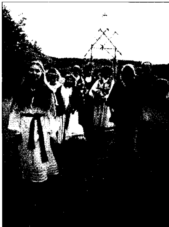
Eitynės prie aukuro.

„Linksmojoje dalyje", aišku, neapsieinama be šokių.